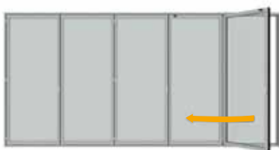
Leichtes Öffnen des äußeren Flügels Easy opening of the first panel