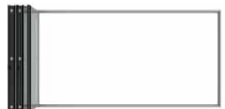
Parken der faltflügel Parking of the folded panels