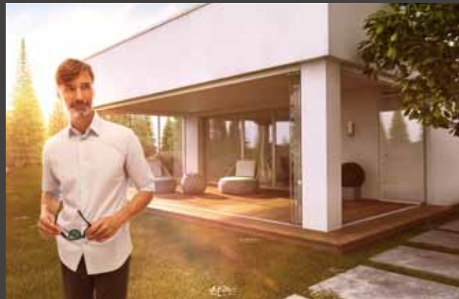
Schiebe-Dreh-Systeme Slide and Turn Systems