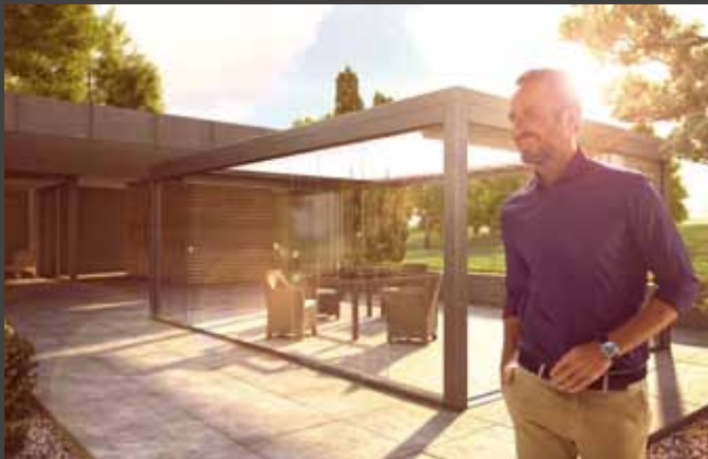
Schiebe-Systeme Sliding Systems