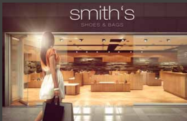
Horizontal-Schiebe-Wand-Systeme Horizontal Sliding Wall Systems